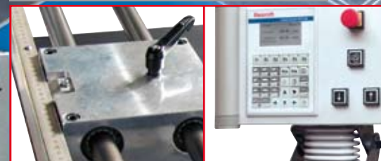
KPS 130 S / SE / DIGITAL