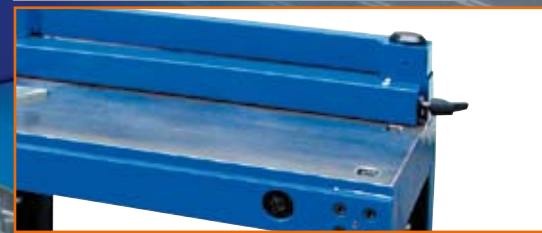
KPS 102 S / SE / DIGITAL